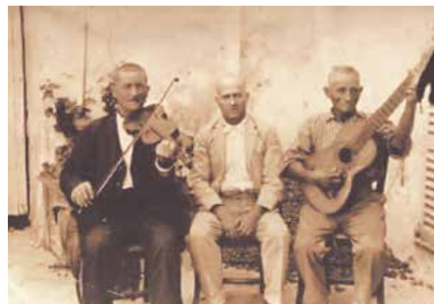
Sonadors, Manacor 1926